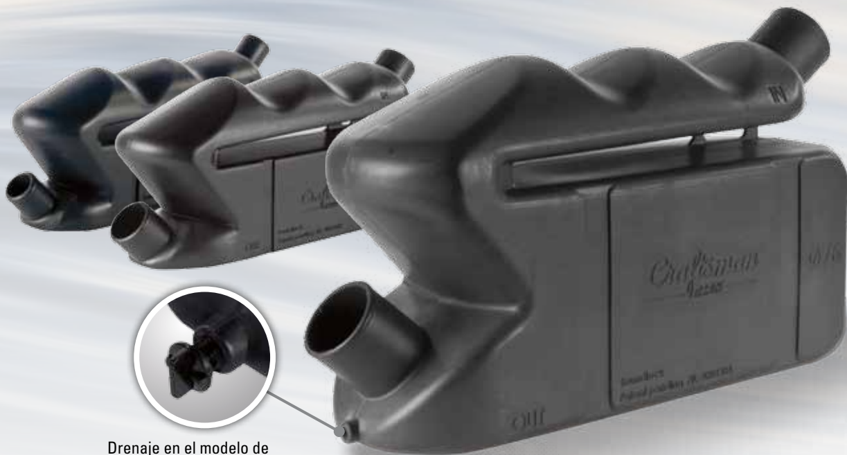
Drenaje en el modelo de 76mm y superiores.

Para simplificar la relativamente difícil instalación de un motor, Craftsman Marine ha combinado el silencioso y el colector en su sistema de escape. El resultado es una reducción de costes y tiempo de instalación, además de ocupar menos espacio. Los accesorios de montaje van incluidos.