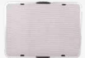
Mosquiteras opciones para todos los modelos.